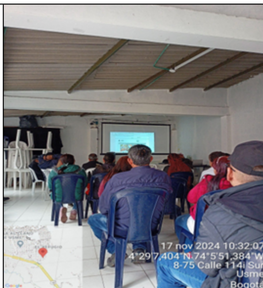
Jornadas de socialización con las comunidades de Villa Hermosa y Portal del Divino