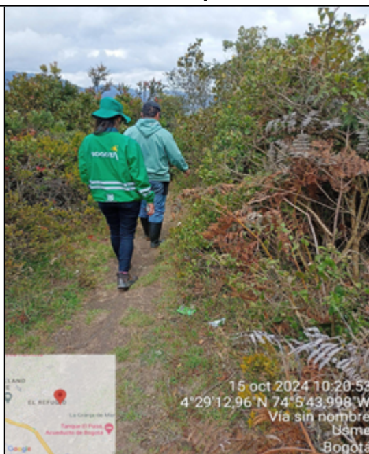
Recorridos con líderes de las JAC de Villa Hermosa y Portal del Divino